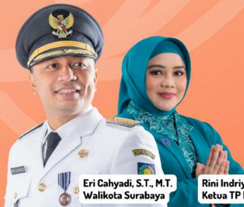
Eri Cahyadi, S.T., M.T. Walikota Surabaya

"Bersama, menjadikan Surabaya yang beragam dengan kepedulian sosial yang tinggi. Kita semua adalah keluarga."